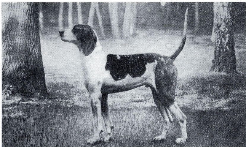
Normand-Poitevin du Petit-Jard.

Brunier 2 , mon fidèle second, qui ne m'a jamais quitté depuis la formation du vautrait, a droit à toute ma reconnaissance. C'était un veneur accompli, une trompe modèle, ayant une connaissance absolue de la chasse, valet de limier incomparable. Avec le Fox-Hound « Flyer », je lui dois mes plus beaux rembûchés. Il n'aimait à monter que des chevaux « ro-