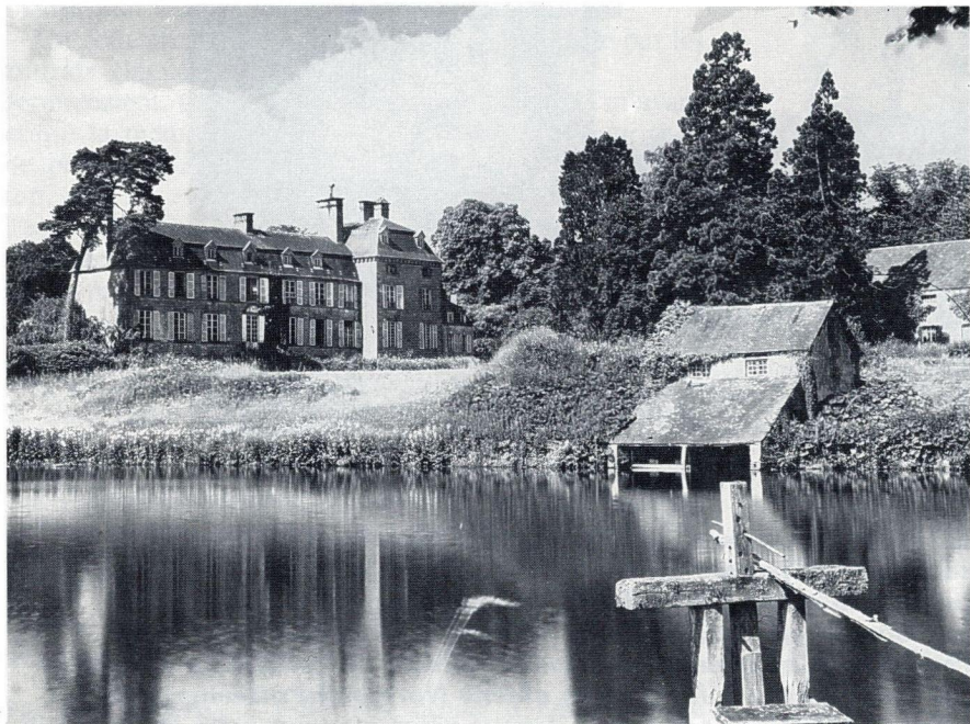
Le château du Grais.