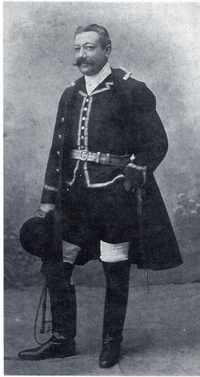
Le marquis de Maleyssie.

Tout le monde monte à cheval et en route, précédé de la meute pour la brisée. Les chiens sont bien sous le