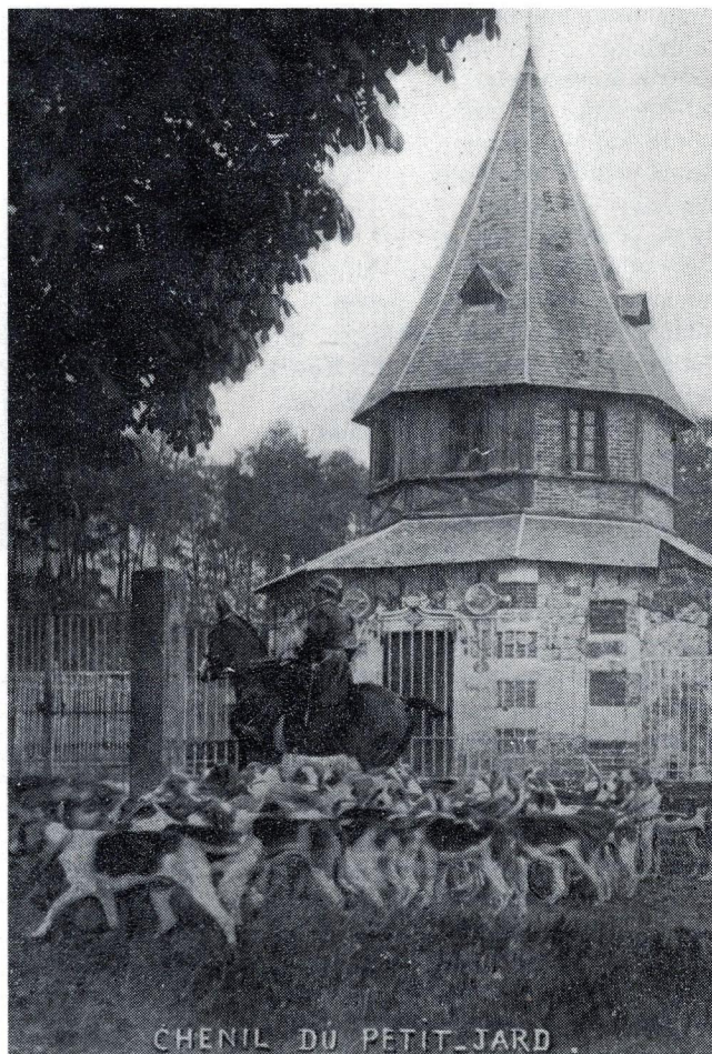
CHENIL DU PETIT-JARD.

cochon ! ». Une demi-heure après, grâce au récri des chiens frais, pas mal de chiens avaient rallié, et dans le bois de Citeaux, le ragot faisait son ferme roulant, puis son hallali courant. Sans la vigueur de La Retraite et son énergie à faire vingt kilomètres en ralliant à la voix des chiens, sans son flair pour se rendre compte de l'endroit où l'animal de chasse devait passer et se trouver, en prenant les grands devants à son passage, nous n'aurions jamais pris ce ragot. Voici à quoi peut servir un relais, mais tout dépend de l'homme qui le conduit !